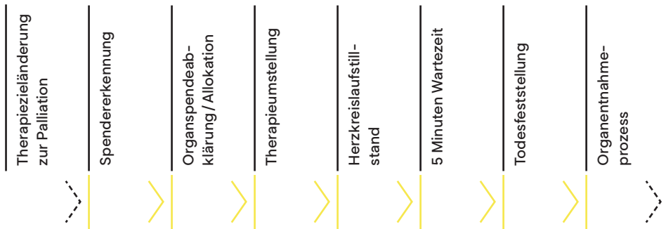
Abbildung 2: Schema Prozessschritte DCD