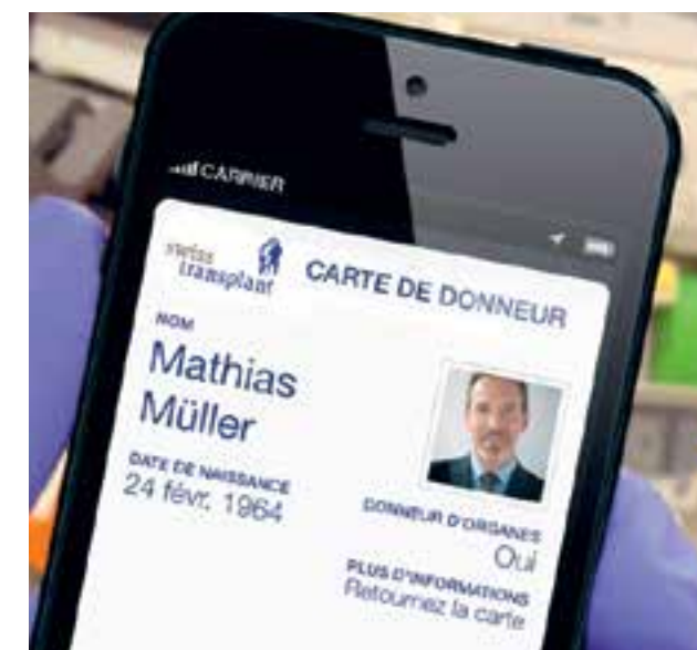
Plus de 90 % des utilisateurs de la carte de donneur électronique aimeraient devenir donneurs.