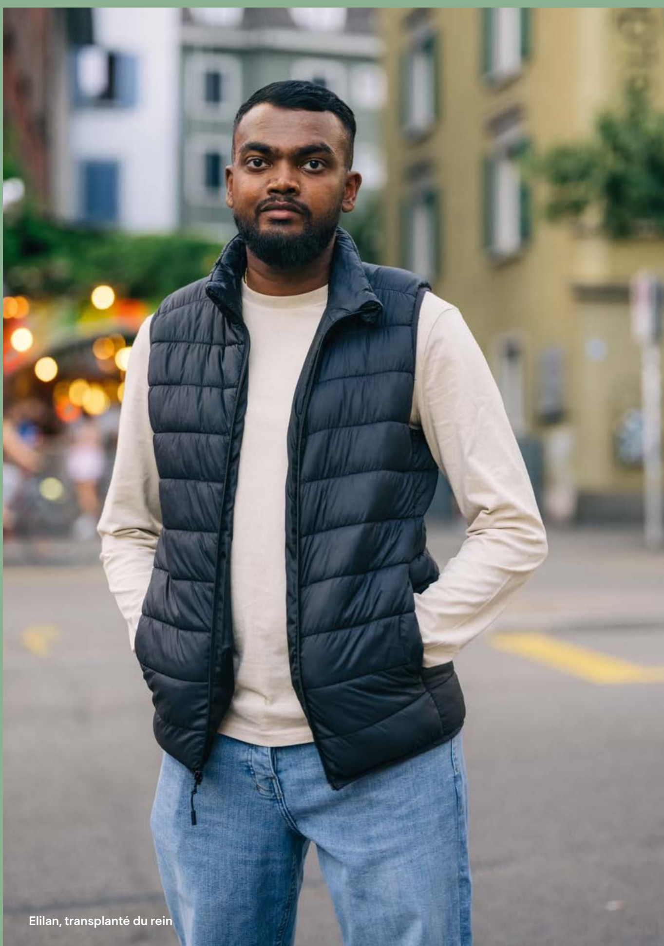
Etilan, transplanté du rein