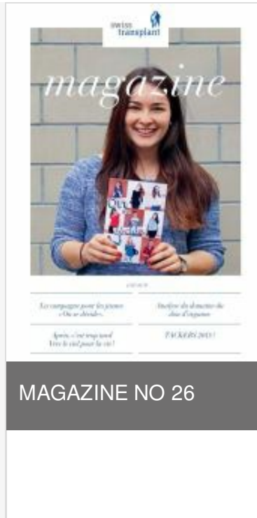
MAGAZINE NO 26