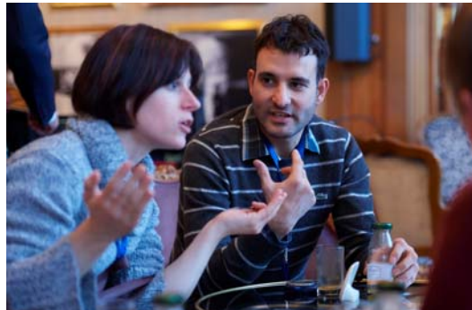
Photos du 2e colloque d'hiver 2017

Une manifestation couronnée de succès qui se poursuivra certainement l'année prochaine.