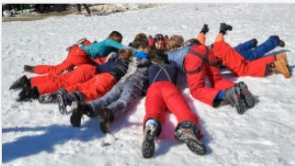
ALBUM PHOTO DU TACKERS

Autres manifestations de Swisstransplant