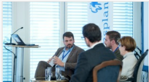
ALBUM PHOTO DU SYMPOSIUM