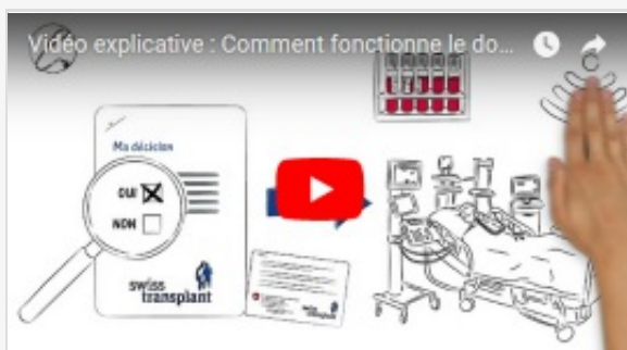
VIDÉO EXPLICATIVE: PROCESSUS DU DON D'ORGANES

Nous vous souhaitons une agréable lecture !