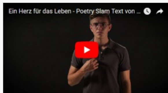
SLAM DE POÉSIE : «EIN HERZ FÜR DAS LEBEN» (EN ALLEMAND)