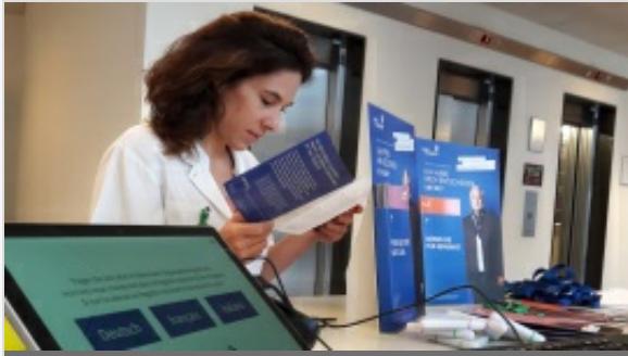
ALBUM PHOTO DE LA JOURNÉE NATIONALE DU DON D'ORGANES