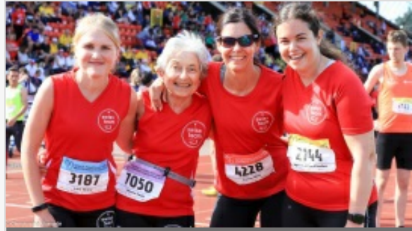
ALBUM PHOTO DES JEUX MONDIAUX DES TRANSPLANTÉS